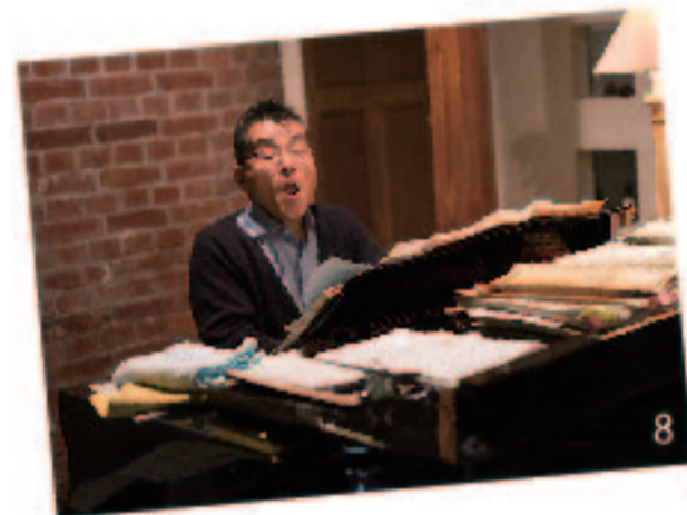
岩田酒店3代目当主でテノール歌手でもある岩もといさんが毎週土曜日にコンサートを開いている。国立音楽大学・同大学院、オーストリア国立ウィーン音楽大学の出身