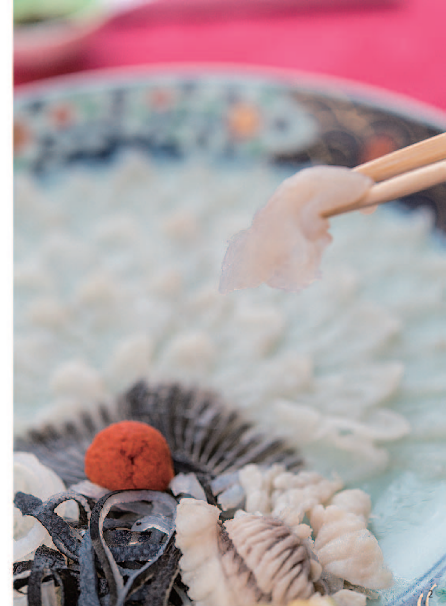
2. アインシュタイン博士が宿泊した重要文化財 旧門司三井倶楽部で食べるふぐは格別。3. 甘いたれがかかったふぐの唐揚げは病みつきになりそう