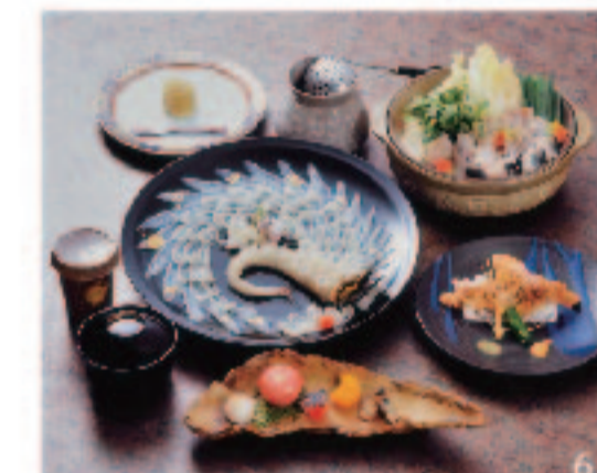
1.6 てん花 問) 093-331-8080 営) 11:30~14:00 17:30~22:00 休) 不定休