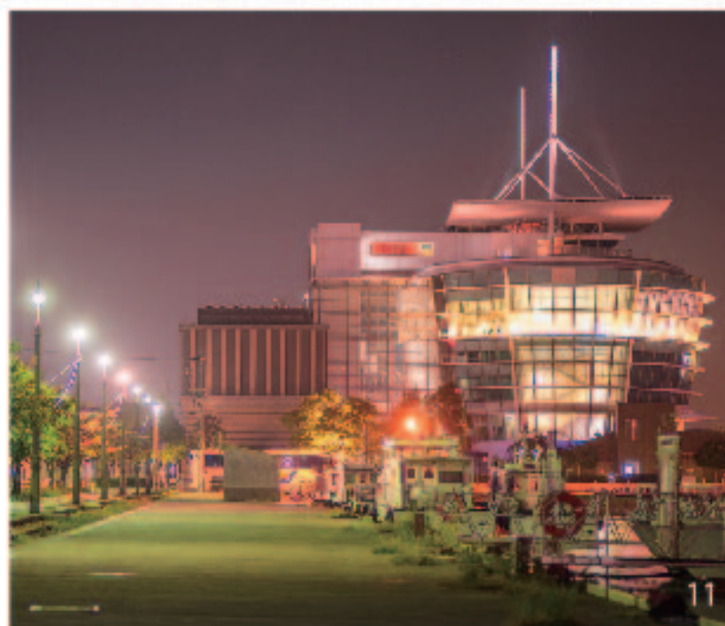
9. 門司港レトロ展望室からの夜景 10. 恋人の聖地 ブルーウィングもじ (はね橋) 11. 西海岸の関門海峡ミュージアム