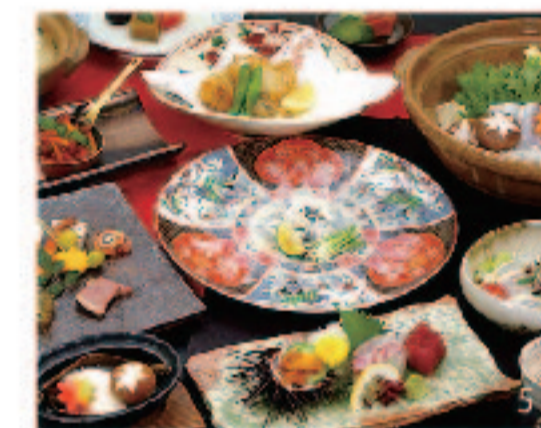
4.5 三宜楼茶寮 問) 093-321-2651 営) 11:30~15:00 (LO14:00) 17:00~21:00 (予約制) 休) 月曜日※祝日の場合は翌日が休み