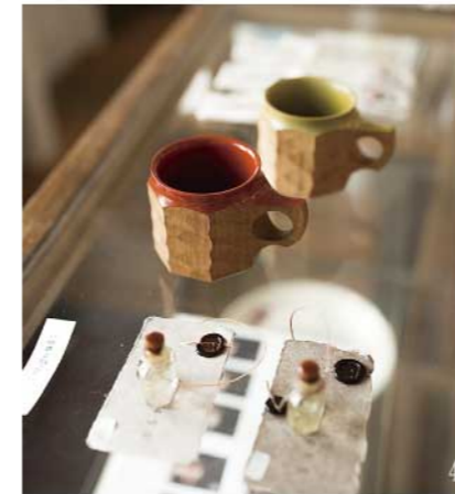
鹿児島産のタブノキを削りだして制作された木製のカップ。あざやかな赤やグリーン部分は漆塗りです。