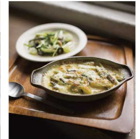
ホワイトソースの代わりに生クリームを使った、季節のお野菜とチーズがたっぷりと入ったコクのあるグラタン。