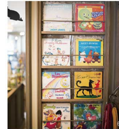
古いフランスのレコードたち。パリから郊外に行った蚤の市で知り合ったおじいさんに譲ってもらったそうです。赤ずきんのレコードを買いました。