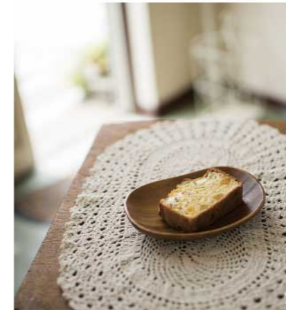
アルミの入っていないベーキングパウダーやフランス産の塩、季節のお野菜を使ったフランスの塩ケーキ「ケーキサレ」。ワインのお供にしています。