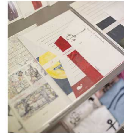
すべて手作りで作られたレターセット。色も一枚一枚すべて手作業で塗っているそうです。大切な人に手紙をしたためました。